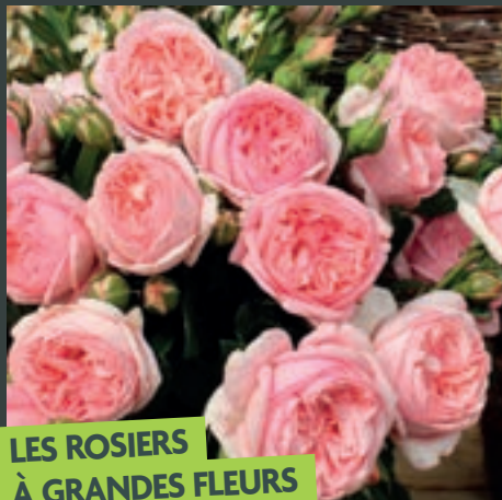
LES ROSIERS À GRANDES FLEURS

Pour des plantations isolées, des massifs hauts et des fleurs coupées.