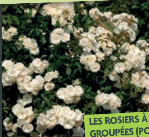
LES ROSIERS À PETITES FLEURS GROUPÉES (POLYANTHAS)

Un rosier est un investissement à long terme puisqu'il restera en place au jardin dix à quinze ans en moyenne, voire davantage. Au moment de l'achat, il vaut mieux choisir ce qui se fait de mieux. Voilà pourquoi nous avons choisi une gamme complète de rosiers sélectionnés pour leurs qualités exceptionnelles. Quel que soit l'effet que vous recherchez, vous trouverez parmi la gamme Teragile , les rosiers les plus remarquables dans chaque catégorie. Nos rosiers sont vendus en contenant et prêts à être plantés.